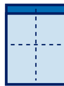
Paso 1 Step 1